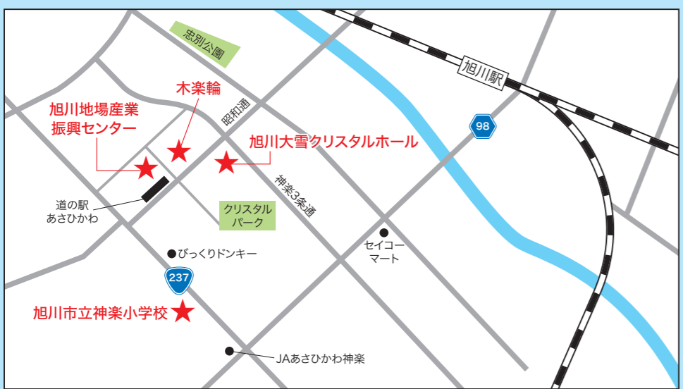
旭川市立神楽小学校 旭川市神楽5条8丁目 TEL.0166-61-1171