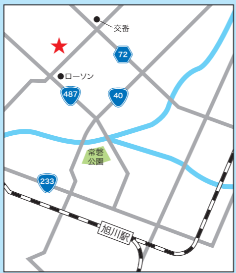
天使幼稚園 旭川市大町1条10丁目 TEL.0166-62-2932