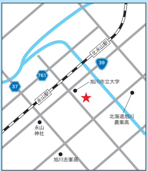
志峯幼稚園 旭川市永山5条23丁目 TEL.0166-48-3126