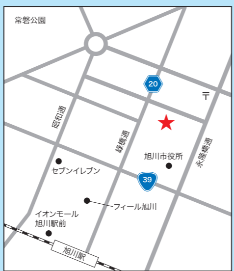
旭川市民文化会館 旭川市7条通9丁目 TEL.0166-25-7331