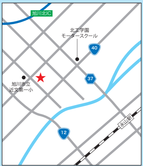
つくし幼稚園 旭川市東鷹栖2線11号 TEL.0166-57-2222